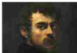
JACOPO ROBUSTI (TINTORETTO)