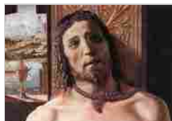
CRISTO ALLA COLONNA DONATO DI ANGELO DI PASCuccio (BRAMANTE) PINACOTECA DI BRERA