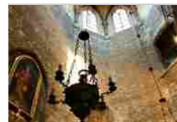
CAPPELLA DI GERUSALEMME BRUGES