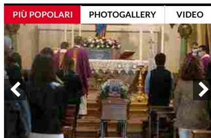
PIÙ POPOLARI PHOTOGALLERY VIDEO Grande commozione ai funerali di Riccardo Gamberini, il pilota vittima del tragico incidente aereo sui cieli di Ravenna

La Fondazione ha proseguito quindi il suo percorso di consolidamento della propria identità di ente del Terzo settore, sempre più distaccato dall'ambito bancario da cui ha tratto la sua origine (il peso di Unicredit è passato dal 70% del patrimonio del 2015 al 5% nel 2020 con una riduzione rilevante del rischio).